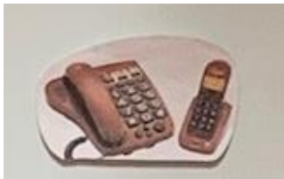
On appelle avec un téléphone

A chaque fois, il faut s'arrêter (faire STOP) pour regarder ce qui s'est passé, puis il faut enlever le danger pour éviter un autre accident puis on va voir un adulte qui appellera les secours.