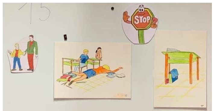
La maîtresse est tombée