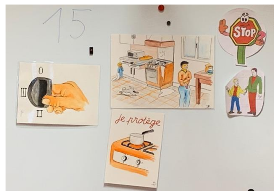
Un enfant s'est brûlé.