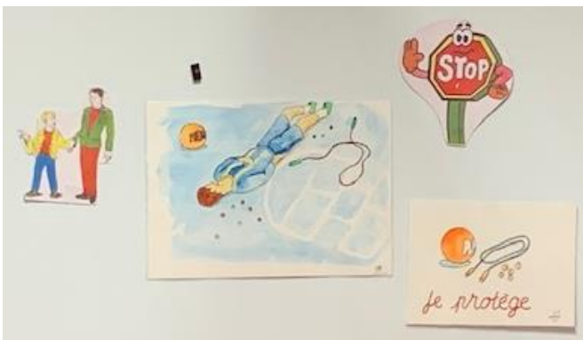
Un enfant est tombé dans la cour.