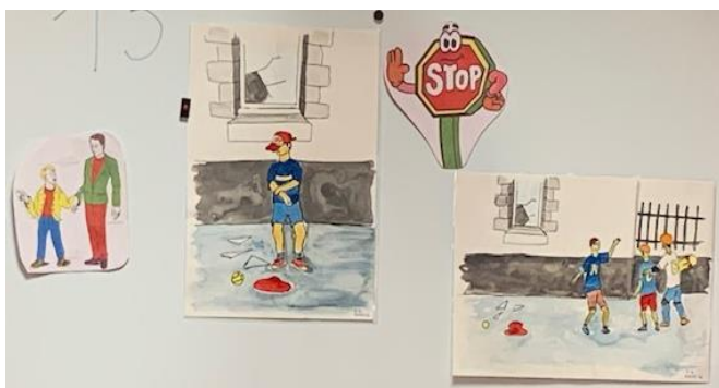
Un enfant s'est blessé avec un morceau de verre