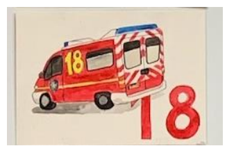
le SAMU (15) ou les pompiers (18)