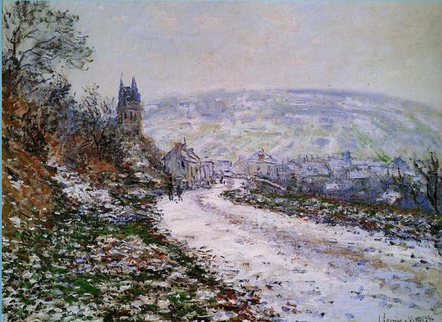
Arrivée au village de Vétheuil en hiver, Claude Monet (1879)