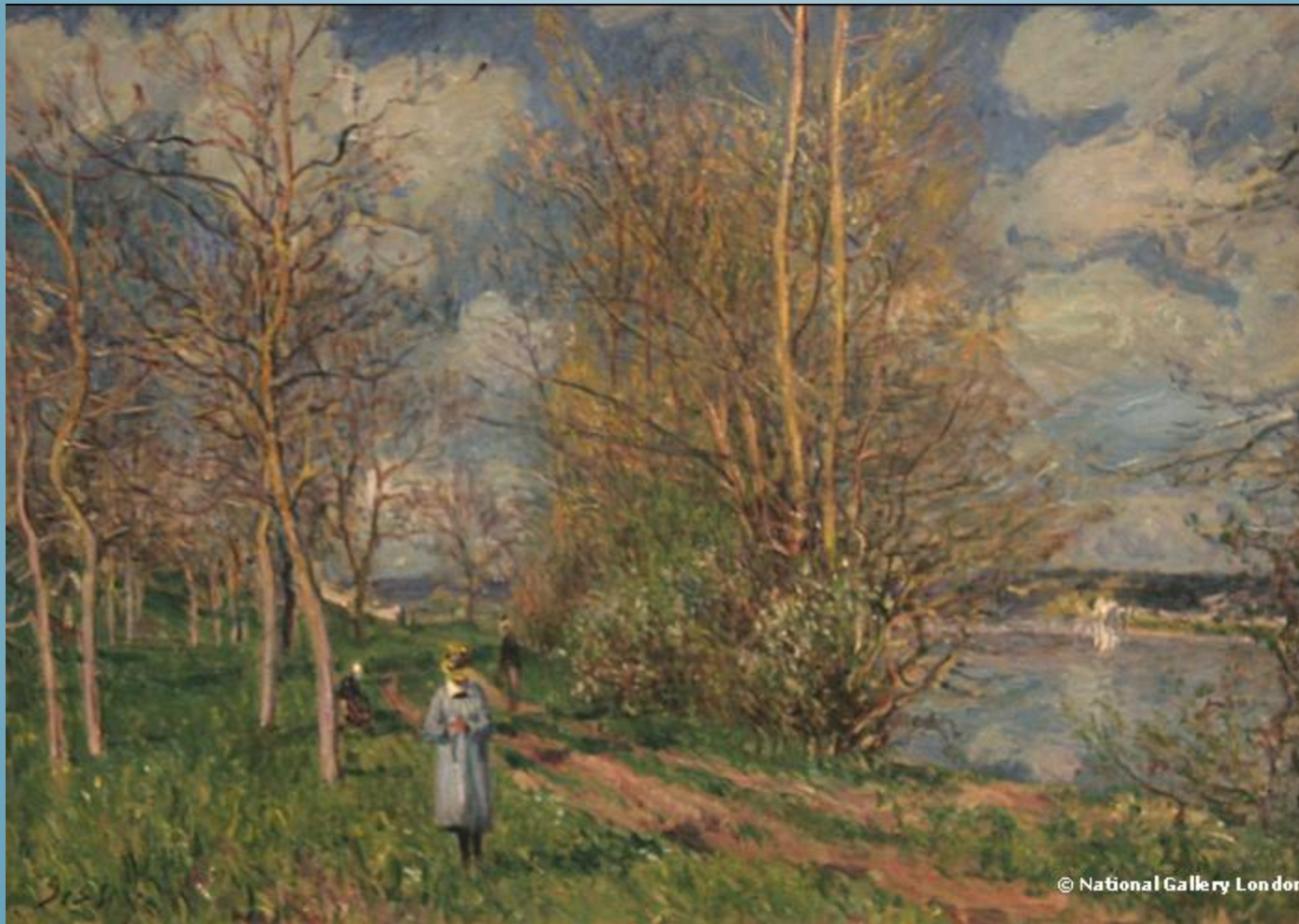
Les petits prés au printemps, Alfred Sisley (1881)