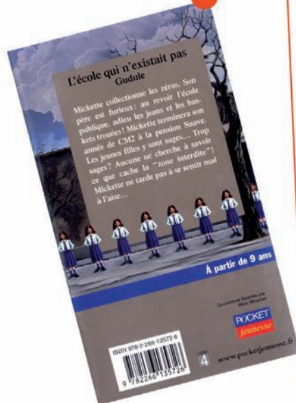
L'école qui n'existait pas , Gudule, Pocket Jeunesse

seulement ça la déboussole en la séparant de ses copains et en interrompant son programme scolaire, mais, en plus, aucun établissement n'en veut : on n'inscrit pas d'élève au beau milieu de l'année !