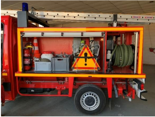
Un côté du camion

Nous avons vu le camion et tout le matériel qu'il y avait dedans. Sur un côté, il y a des tuyaux, des plots, des lances, un extincteur et un panneau pour dire attention