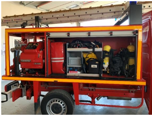
L'autre côté du camion

De l'autre côté du camion, nous avons vu la pompe sur laquelle on branche les tuyaux. Dans ce camion, il y a une réserve pour mettre de l'eau.